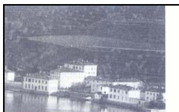
I tre grandi caseggiati "filanda, incannatoio e filatoio"

Non tutti forse sanno che il nostro Comune, per circa un cinquantennio visse nel segno delle filande. Le filande, erano stabilimenti per la lavorazione della seta che consisteva nell'aggomitolatura dei bozzoli del baco da seta, immersi nell'acqua fortemente riscaldata (contenuta in apposite bacinelle), al fine di poterne togliere con le sole dita, il prezioso filo di seta. Questa attività risultò presente sul territorio di Paradiso già dall'inizio del settecento. Da quel pe-